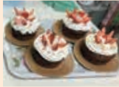
バレンタインデーは、手作りケーキで♡